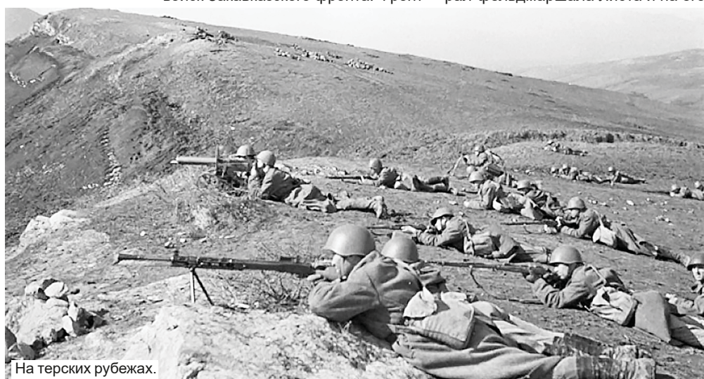
На терских рубежах.